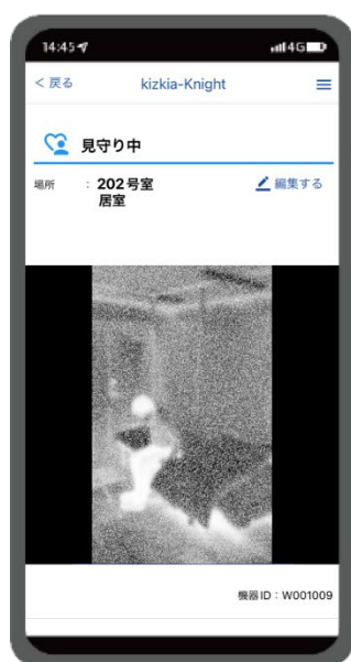
【図 1】 kizkia-Knight R プライバシーモード画面