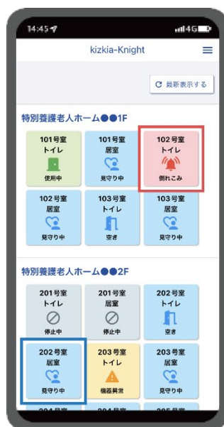
【図 2】 kizkia-Knight 居室・トイレ共通一覧表示画面